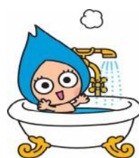
盛岡ガス マスコット キャラクター ぼっぼちゃん