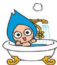
盛岡ガス マスコット キャラクター ぼっぼちゃん